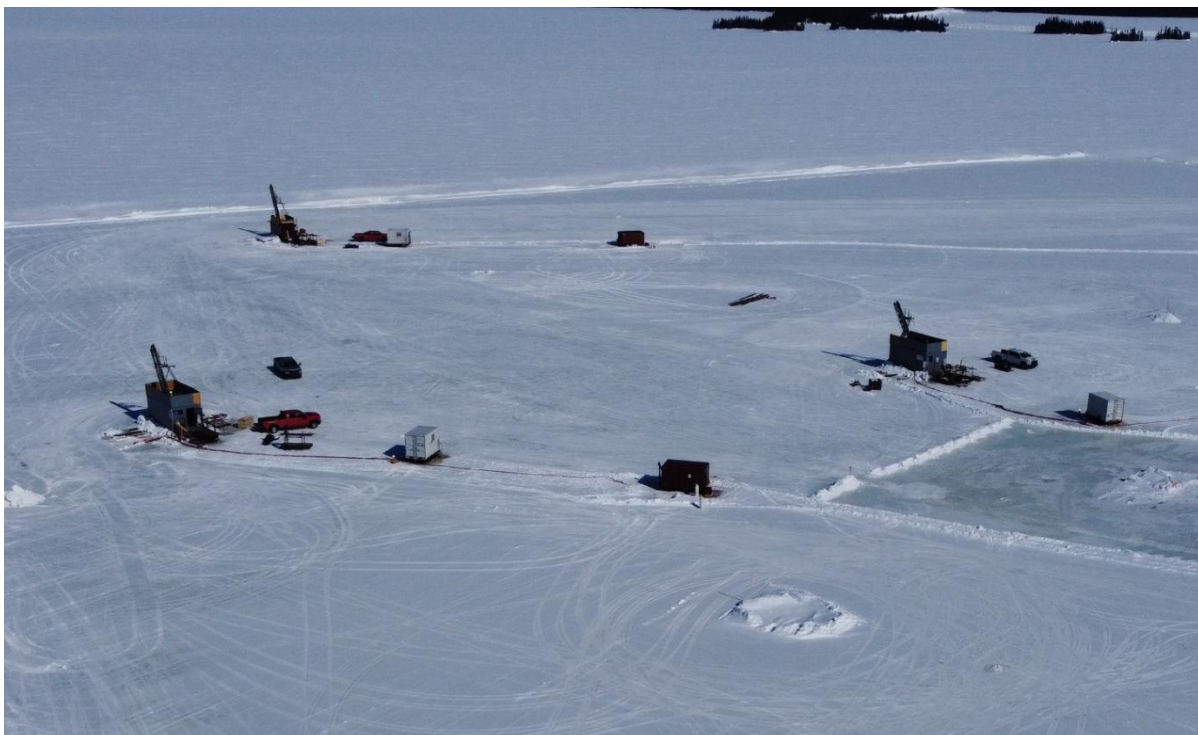
Figure 2 : Trois foreuses complétant le programme de conversion des ressources de Golden Eye sur la plateforme de glace aménagée (mars 2026).